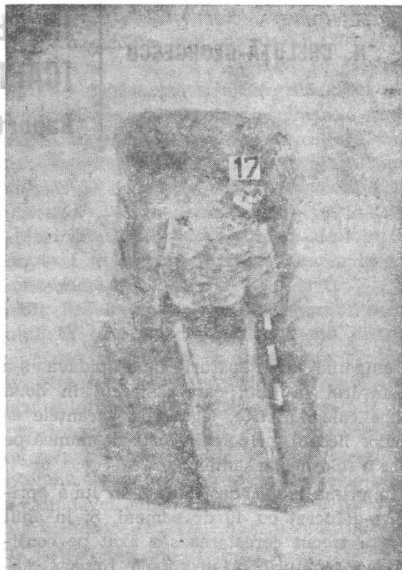
Fig. 1. Capidava T8.

Mormîntul nr. 2 . Este un mormînt de incinerare, din categoria mormintelor „în trepte”, cu incinerare pe loc. Cercetat în secțiunea A acesta se prezintă astfel: o groapă dreptunghiulară lungă de 2,80 m, lată de 1,50 m, în care s-a practicat săparea altei gropi (groapa de incinerare propriu-zisă) dreptunghiulară, adîncă de 0,60 m, lată de 0,50 m și 2 m lungime. Orientarea acestei gropi sud-vest nord-vest, oasele calcinate ale cutiei craniene au fost surprinse în partea de sud-vest a gropii. Tot în această parte, pe prispa formată de adîncitura gropii de incinerat și prima groapă dreptunghiulară mai mare, erau așezate trei tuburi de apeduct cap la cap, lungi de 0,61 m. Sub ele s-au găsit două lacrimarii ceramice și un opaiț. În jurul gropii de incinerat, care prezenta o crustă puternic arsă, erau așezate celelalte ofrande: vase ceramice tip fructieră, opaițe ceramice, vase de uz comun din